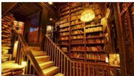
Médiathèque de l'IFOCAP