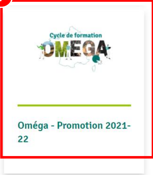
Oméga - Promotion 2021-22