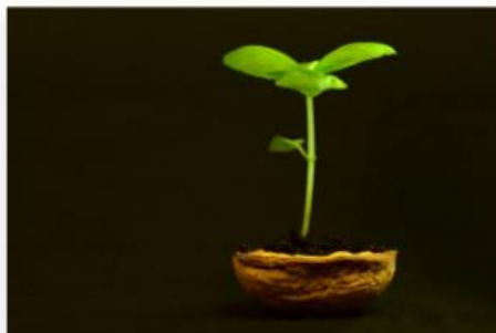
Omég@ - Promotion 2020-21